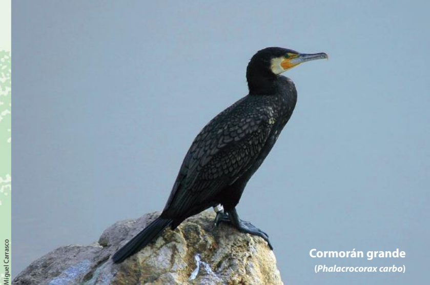
Cormorán grande ( Phalacrocorax carbo )