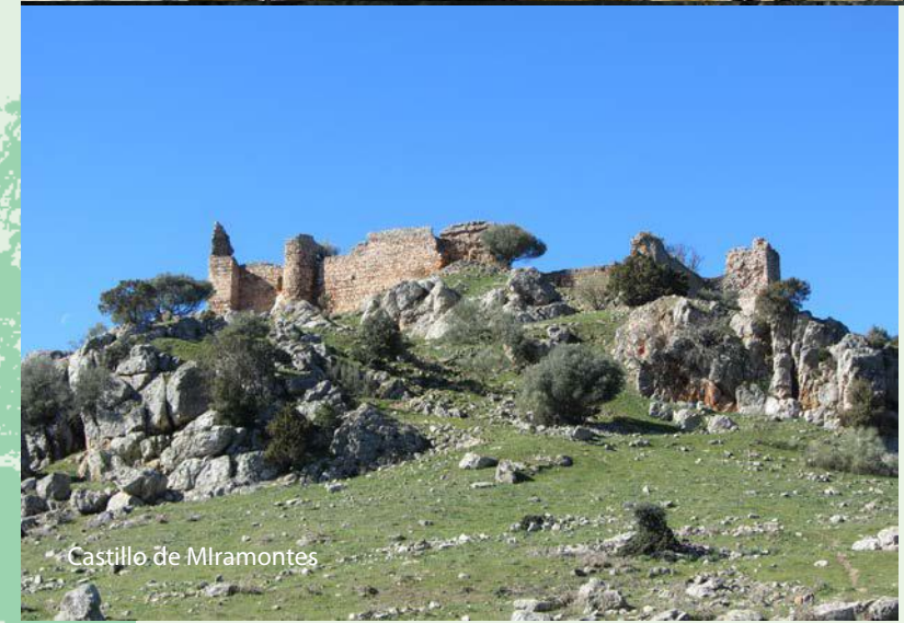
Castillo de Miramontes