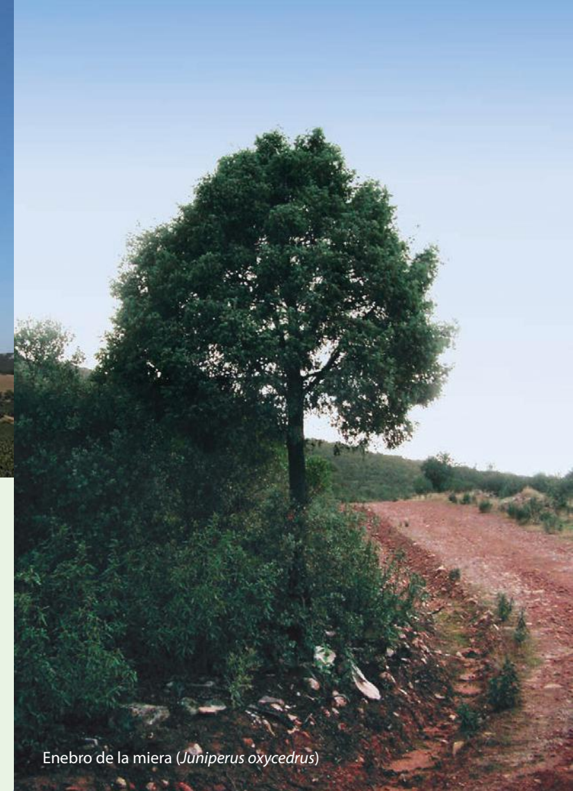
Enebro de la miera ( Juniperus oxycedrus )

A pesar de los picos y los mazos de los grandes señores castellanos que cumplieron la sentencia, aún se conservan importantes restos de esta fortaleza, como la torre del Homenaje, un espacioso aljibe, y abundantes despojos de la residencia de los señores y sirvientes.