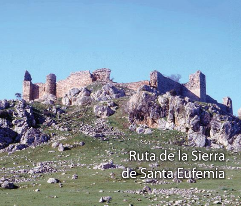
Ruta de la Sierra de Santa Eufemia