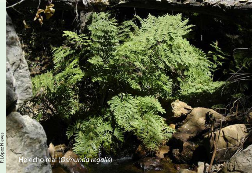
Helecho real ( Osmunda regalis )