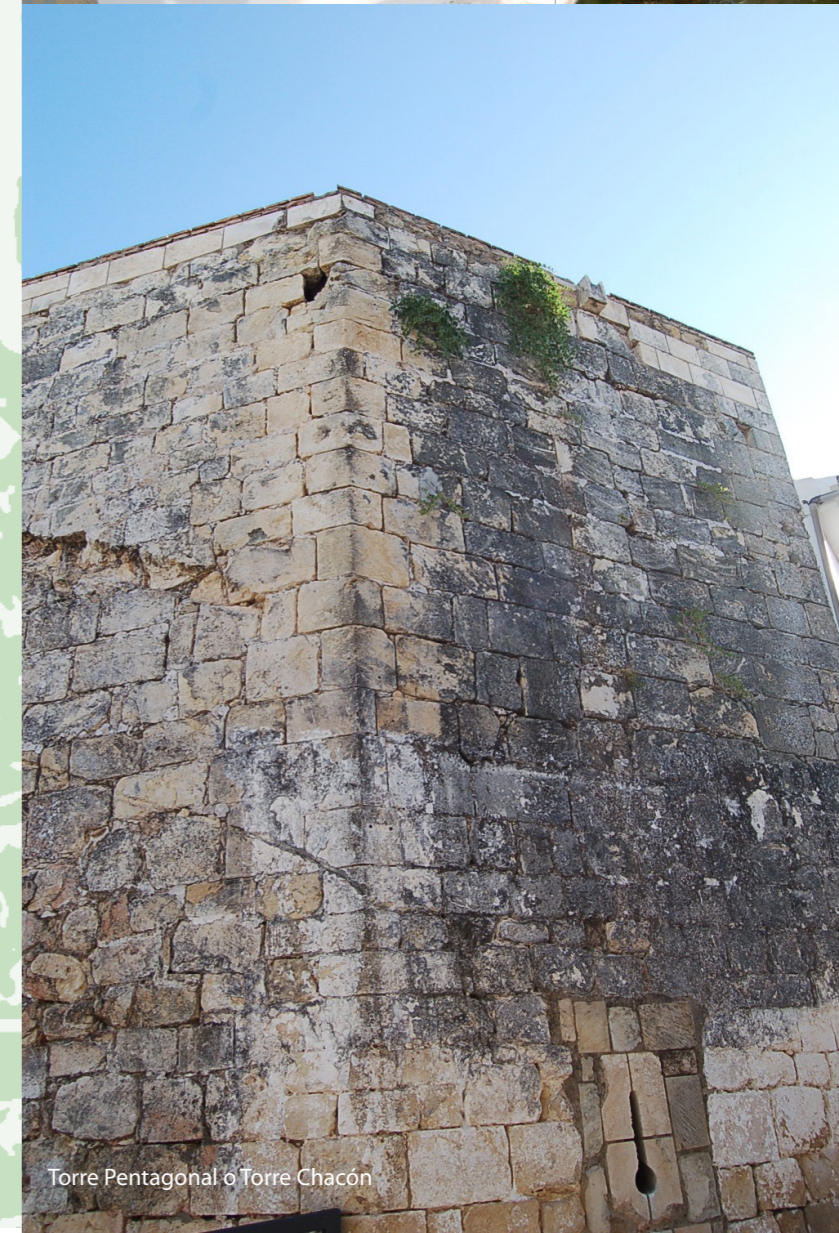
Torre Pentagonal o Torre Chacón