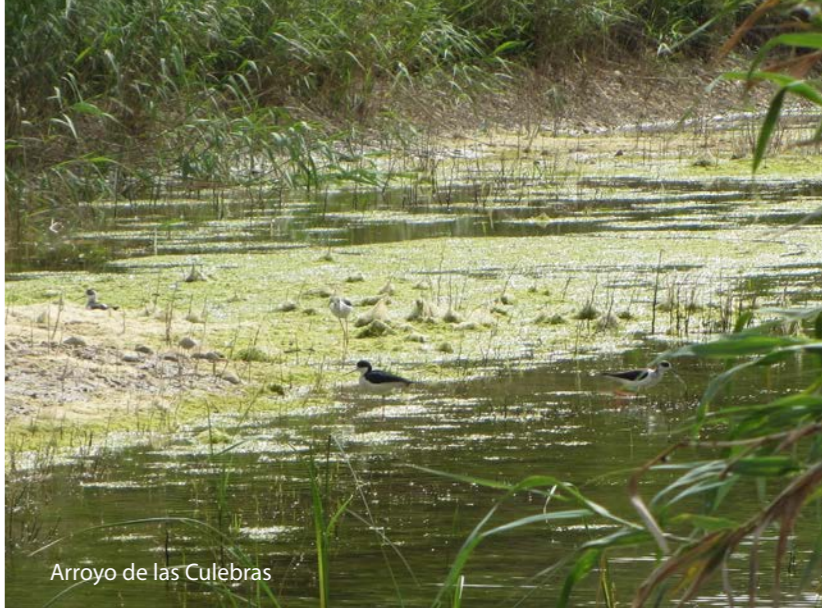
Arroyo de las Culebras