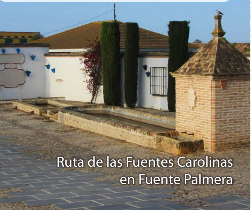
Ruta de las Fuentes Carolinas en Fuente Palmera