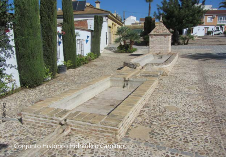
Conjunto Histórico Hidráulico Carolino