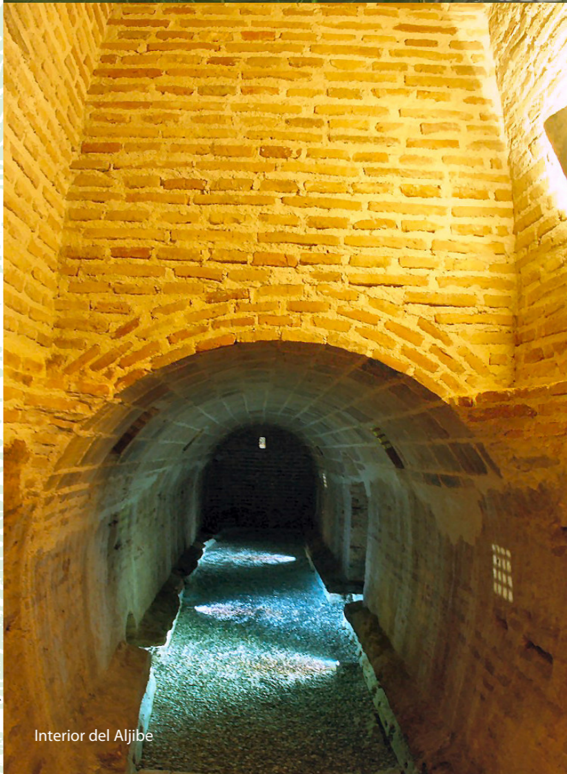
Interior del Aljibe