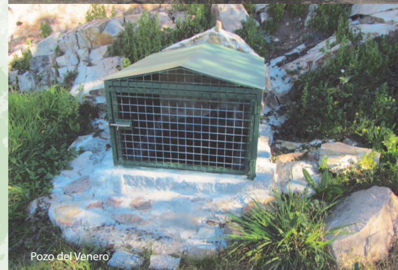
Pozo del Venero