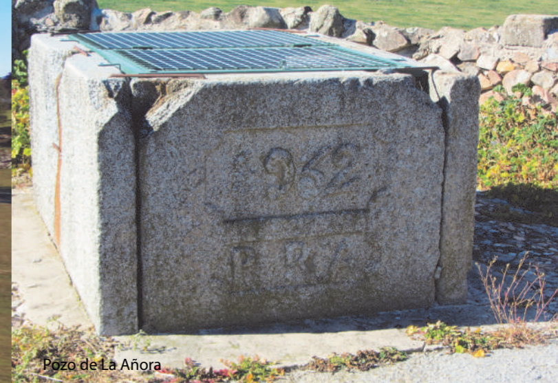
Pozo de La Añora