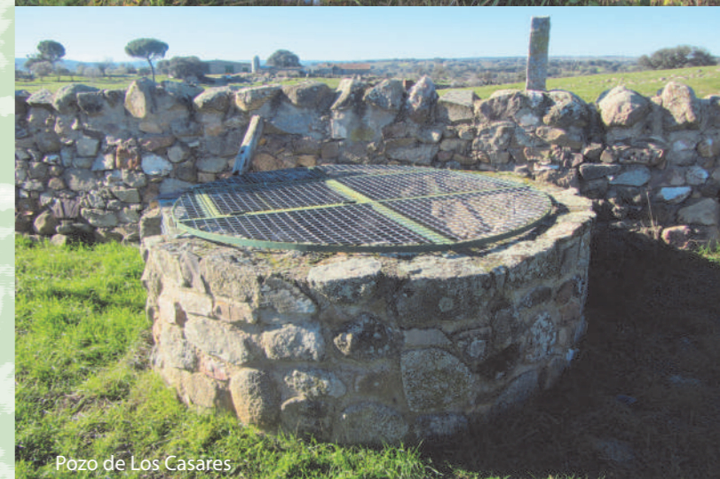
Pozo de Los Casares