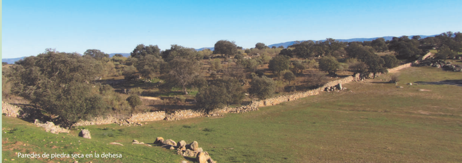
Paredes de piedra seca en la dehesa