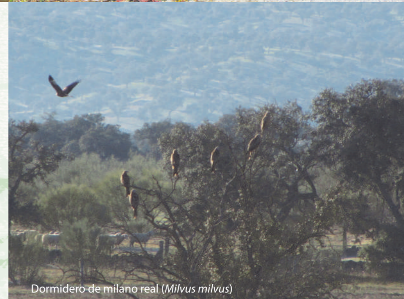
Dormidero de milano real ( Milvus milvus )