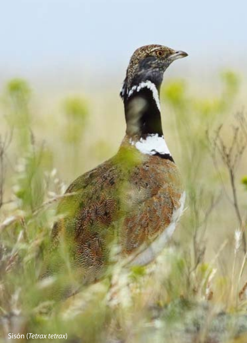
Sisón ( Tetrax tetrax )