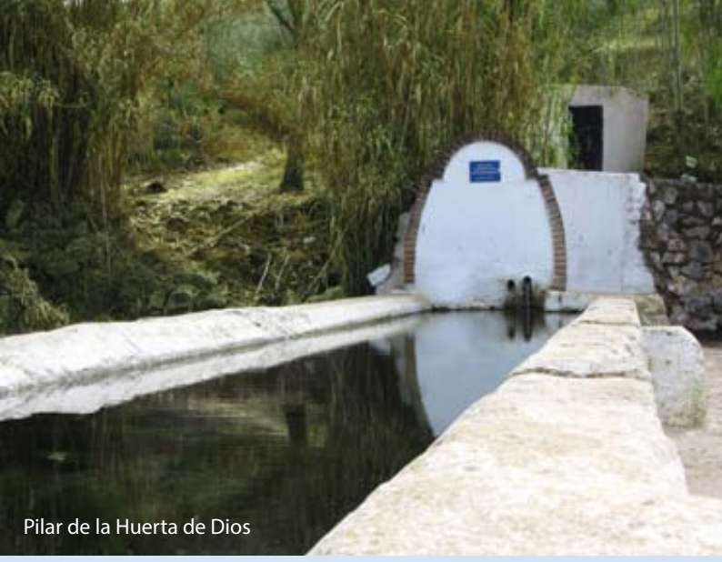
Pilar de la Huerta de Dios