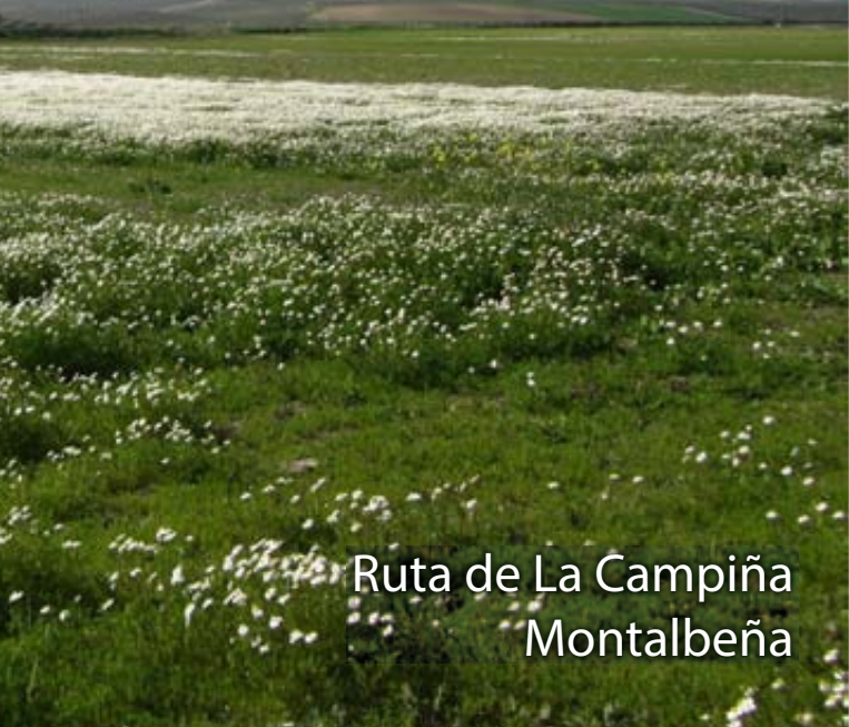
Ruta de La Campiña Montalbeña