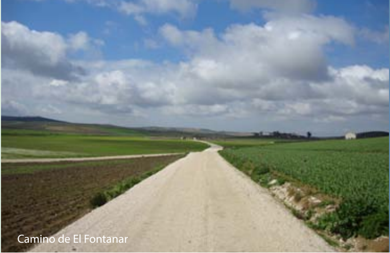
Camino de El Fontanar