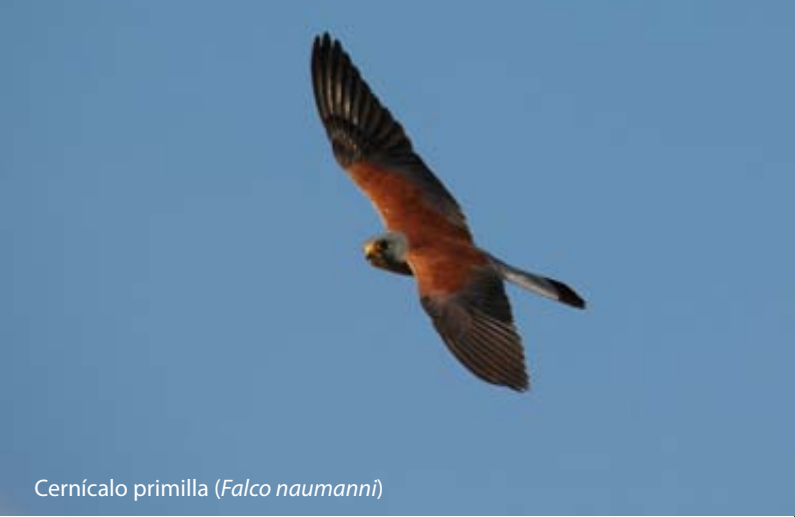
Cernícalo primilla ( Falco naumanni )

La ruta comienza junto al Pilar de la Huerta de Dios, un bello pilar encalado de casi 20 metros de longitud y paraje muy conocido en la localidad pues es en este lugar donde se celebra cada quince de mayo la romería de San Isidro Labrador. El Pilar debía de ser una de las cuatro fuentes que había en los contornos de la villa a mediados del siglo XIX según nos cuenta Ramírez de las Casas en el capítulo dedicado a Montalbán de su Corografía , aunque en esas fechas, no estarían los olmos, almezos y chopos que sin duda mejoran el paraje en la actualidad. Iniciamos nuestro recorrido atravesando el recinto ferial, por el que