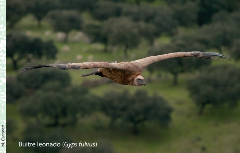
Buitre leonado ( Gyps fulvus )