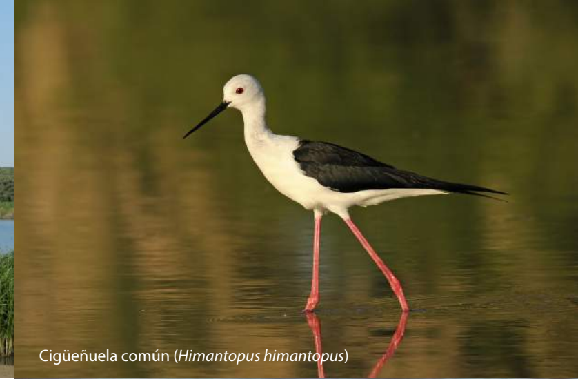
Cigüeñuela común ( Himantopus himantopus )