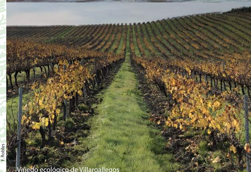
Viñedo ecológico de Villargallegos