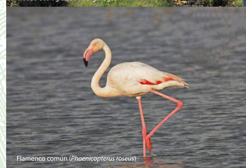
Flamenco común ( Phoenicopterus roseus )