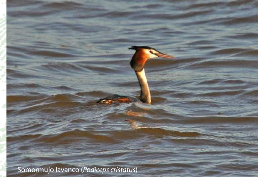
Somormujo lavanco ( Podiceps cristatus )

Santaella constituye uno de los municipios cordobeses de más rancia raigambre arqueológica gracias a la calidad y cantidad de los materiales procedentes de los numerosos yacimientos; alguno de los cuales, como la Camorra de las Cabezuelas –cerro situado cerca del cortijo del Donadío, aguas arriba de Cabra- se puede fechar hasta época Julio- Claudia, con una importancia trascendental en época ibérica. De ese periodo son también los magníficos ejemplos de plástica y estatuaria procedentes del cortijo del Bascón, que junto con otras figuras de toros, équido o leones encontradas en yacimientos cercanos, convierten a Santaella en un núcleo de primer orden para el estudio de la escultura zoomorfa ibérica.