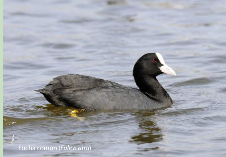
Focha común ( Fulica atra )