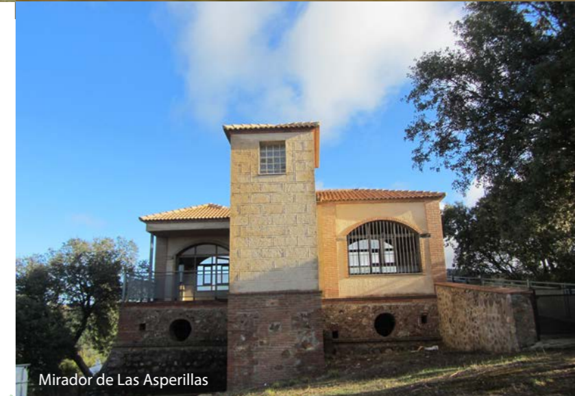
Mirador de Las Asperillas