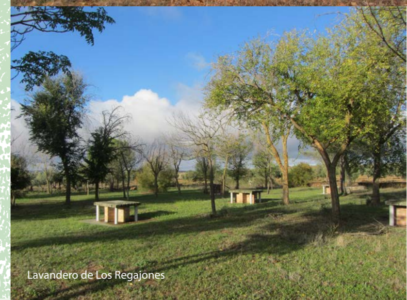
Lavandero de Los Regajones