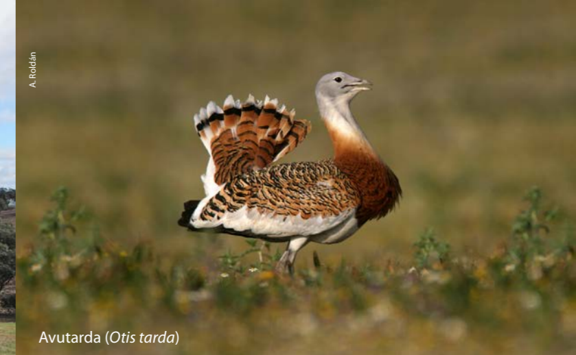
Avutarda ( Otis tarda )

En la ofensiva franquista de junio de 1938, que pretendía llegar a Sierra Noria, el tercer batallón de la 88 Brigada Mixta, que defendía la posición, fue reducido y el lugar pasó a manos franquistas. Poco después, en enero de 1939 (cuando los republicanos pretendían llegar a Peñarroya), dos divisiones del XXII Cuerpo de Ejército republicano volvieron a tomarla; aunque fue una victoria efímera, pues un mes después la abandonaron definitivamente.