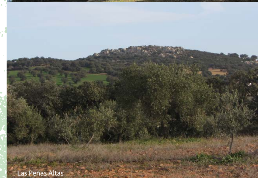
Las Peñas Altas