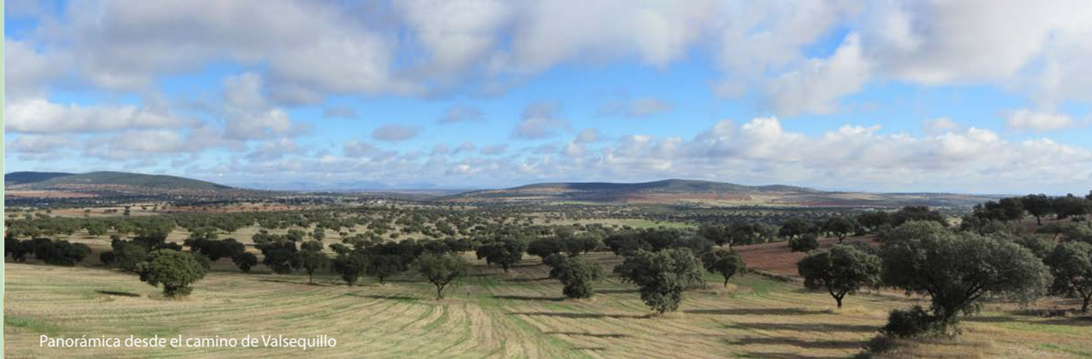
Panorámica desde el camino de Valsequillo